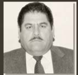
MANUEL TREVIÑO REVELES (EL CORONEL)