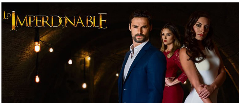
LO IMPERDONABLE JUNIO - NOVIEMBRE 2017 POR EL SALVADOR ABRIL - OCTUBRE 2017 POR BULGARIA