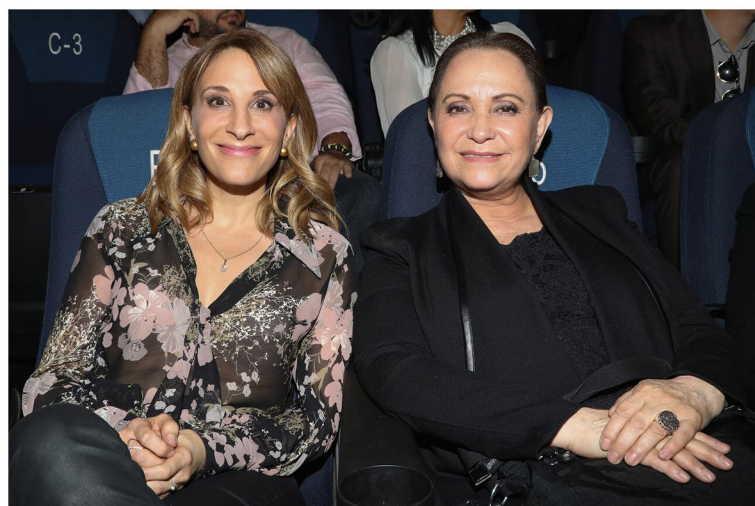
Monica Huarte y Adriana Barraza