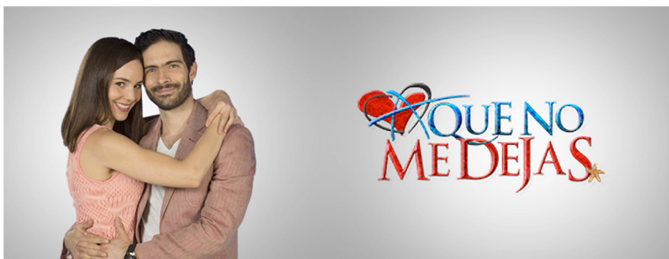
A QUE NO ME DEJAS ABRIL - NOVIEMBRE 2017 POR HUNGRIA