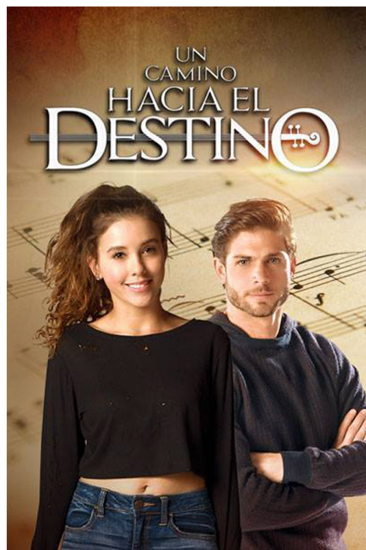
UN CAMINO HACIA EL DESTINO MAYO - NOVIEMBRE 2017 POR REPUBLICA DE GEORGIA