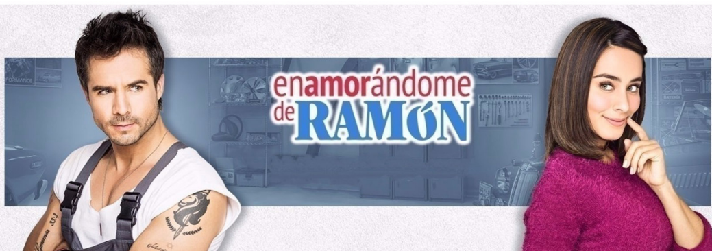
ENAMORÁNDOME DE RAMÓN JULIO - SEPTIEMBRE 2017 POR PERU AGOSTO - NOVIEMBRE 2017 POR PANAMA MARZO - SEPTIEMBRE 2017 POR REPUBLICA DOMINICANA