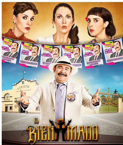
EL BIENAMADO JULIO - NOVIEMBRE 2017 POR REPUBLICA DOMINICANA